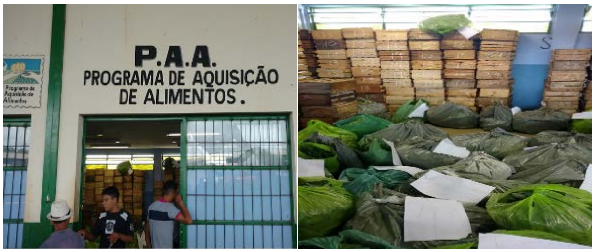
Figura 04: Entrega de produtos ao PAA na Ceanorte de Montes Claros.