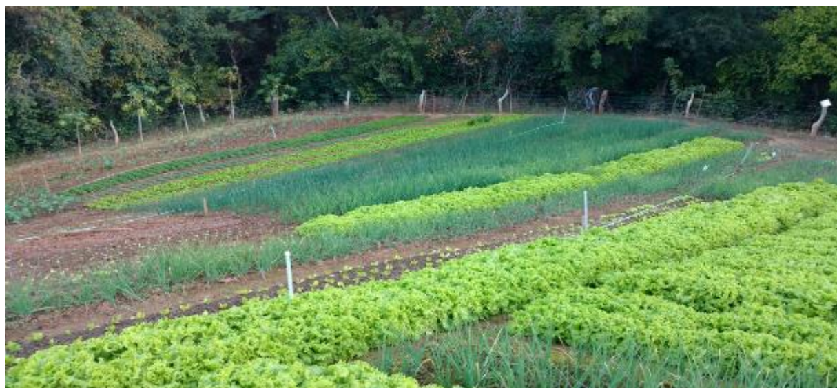
Figura 02 - Horta diversificada de agricultor familiar pertencente à ASPROHPEN

A figura que se segue ilustra a diversificação em uma das propriedades na comunidade de Planalto Rural.